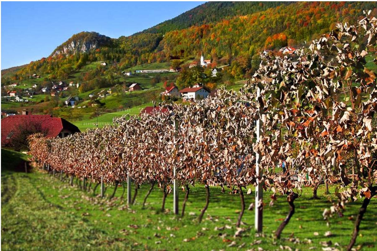
Slika 1: Vinska Gora

Pobočje Lipja in Vinske Gore je bilo do konca 19. stoletja znano po vinogradih in pridelovanju vina, kar se kaže že v imenu pobočja. Za vinogradništvo je primerna tudi geografska lega, saj je pobočje obrnjeno proti jugu in je tudi primernegega naklona. Kljub ugodni legi pa je ta okoliš konec 19. stoletja prizadela trtna uš, ki je iz teh krajev izrinila vinograde, prebivalce pa prisilila v prestrukturiranje v druge kmetijske dejavnosti. Večina prebivalcev se je tako začela ukvarjati s kmetijstvom in sadjarstvom, ponekod tudi s čebelarstvom. Zaradi sorazmerno majhnih kmetijskih površin so tako tukaj nastale domačije manjših kmetov, kjer so redili le nekaj glav živine za lastne potrebe. Družine na tem območju so bile maloštevilne, vse pa so imele zelo malo obdelovalne površine in nič ali skoraj nič gozda. (Vir: http://ks-velenje.si/vinskagora/ )