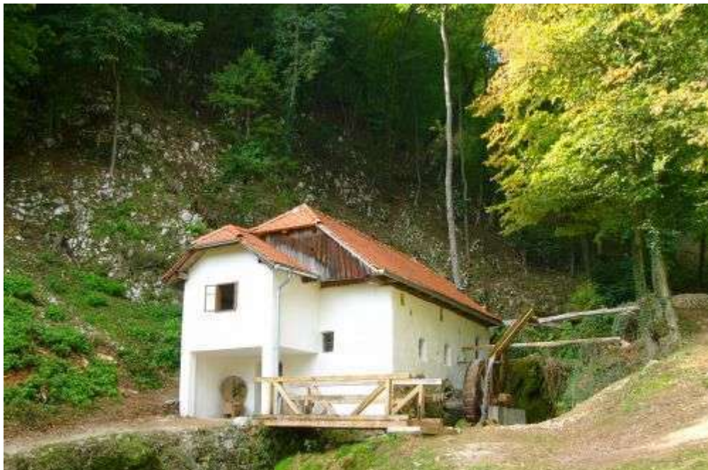
Slika 4: Vovkov mlin (Vir: http://www.slovenia.info/ )

Vovkov mlin stoji na desnem bregu potoka Temnjaški vrec. Njegova starost je ocenjena na približno 450 let. Mlin je imel v svoji zgodovini pomembno vlogo za širšo okolico kraja. Domačini so mu dolgo pravili tudi grajski mlin, saj se je v mlinu mlelo za grajsko gospodo iz bližnjega Kačjega gradu. Po potresu v 18. stoletju, ko se je grad porušil, pa se je mlelo za potrebe gospode iz Novega gradu in bogate okoliške kmete. Mlin je večinoma lesen in ima še ohranjene stope, ki so prava redkost pri nas, saj je poleg teh samo še en tak primerek v Sloveniji. (Vir: www.slovenia.info )