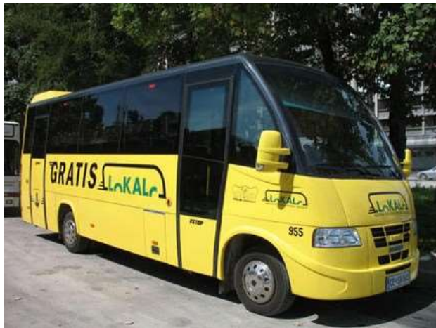
Slika 8: Lokalc