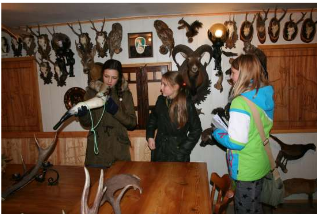
Slika 7: Naš obisk domačije Lamperček in spoznavanje bioloških ostankov divjadi