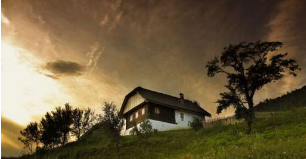
Slika 5: Grilova domačija ( http://www.velenje-tourism.si )

Grilova domačija je v ekomuzej preurejena stara viničarija na nekdanj vinorodnem pobočju Lipja pri Velenju. Domačija obsega hišo s črno kuhinjo, zelenjavni in zeliščni vrt, čebelnjak, vinograd in sadovnjak.