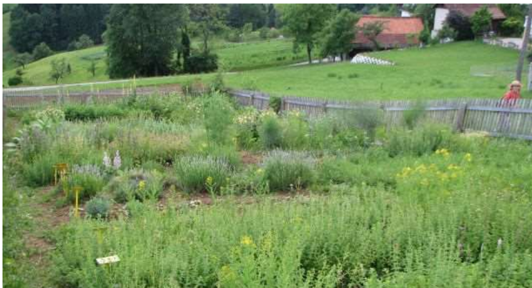
Slika 6: Zeliščni vrt na Grilovi domačiji

Grilova domačija v Lipju pri Velenju ima status kulturnega spomenika lokalnega pomena. Domačija obsega hišo in gospodarsko poslopje. Poleg hiše je še vodnjak, ob hiši pa je manjši zelenjavni vrt, na katerem so gospodinje pridelale zelenjavo za svojo družino. Hiša je potisnjena v breg, vrhkletna, delno lesena in delno zidana stavba. Kletnemu delu je namenjenega zelo veliko prostora, kar tudi dokazuje njen prvotni namen. Strop kleti je lesen in ga podpira mogočna hrastova lega, ki poteka čez celotno širino hiše. Nad kletjo je bivalni del hiše z vežo, črno kuhinjo, »hišo« in »štiblcem«.