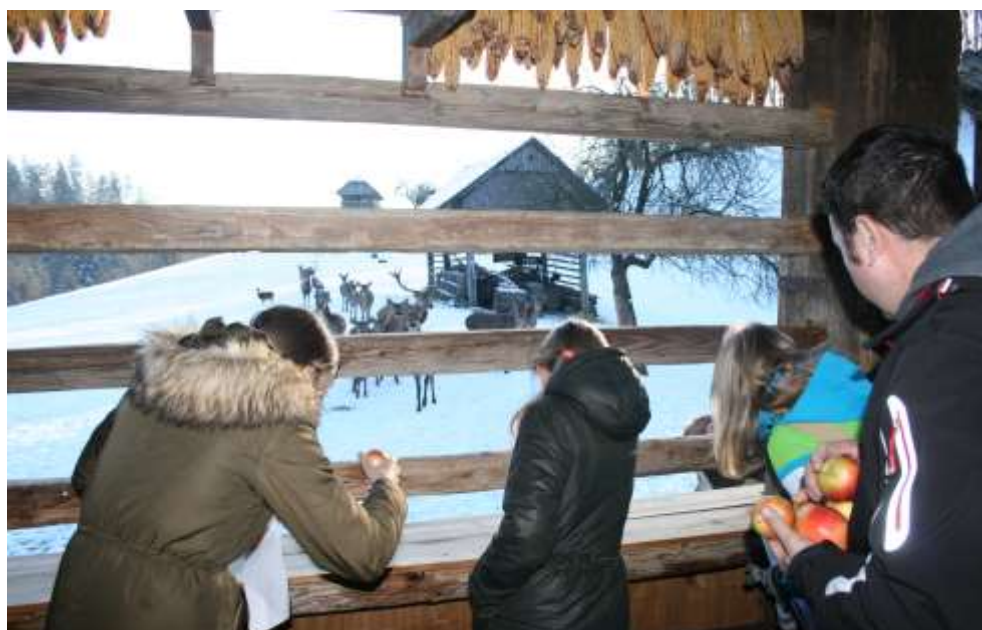
Slika 3: Pod kozolcem domačije Lamperček