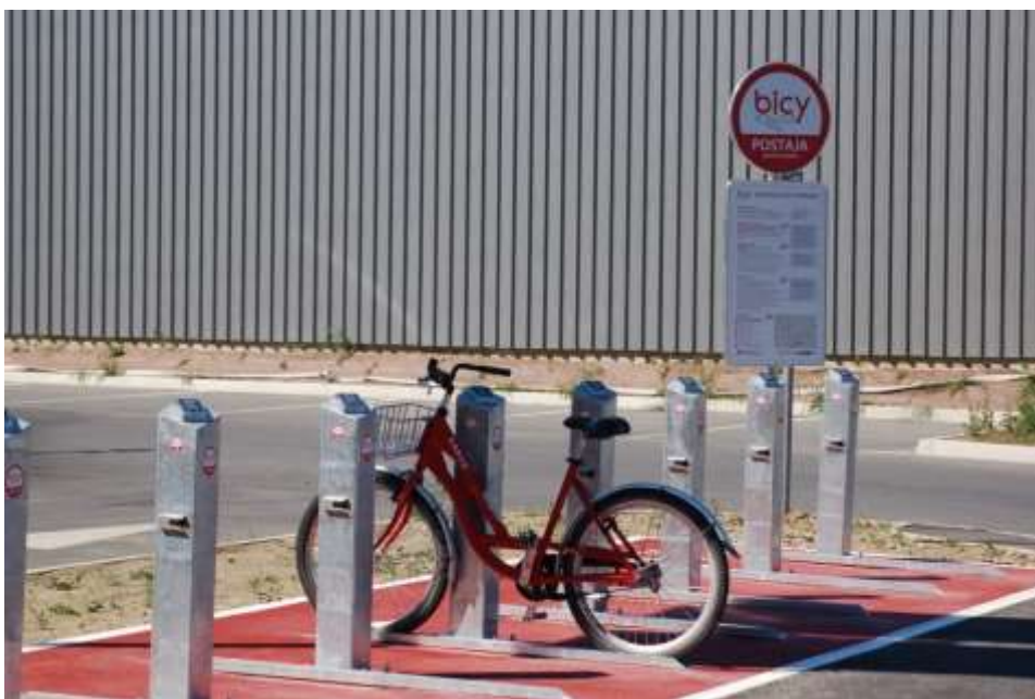
Slika 10: Bicy postajališče

Na voljo je kolesarjenje s kolesi bicy. Omogoča izposojlo kolesa za uporabo v mestnem okolju, do 14 ur na teden za uporabnika. Izposojeno kolo se lahko vrne na katerikoli postaji oziroma prostem stojalu sistema BICY. Za uporabo sistema BICY je potrebna osebna registracija uporabnika. Gostje pa si lahko izposodijo tudi gorska kolesa, ki bodo za to pot primernejša. Registracija se lahko opravi na Turistično-informacijskem centru Velenje (TIC Velenje), klicni center: 080 19 61.