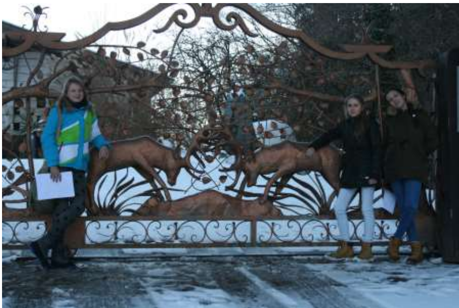
Slika 2: Že mogočna vrata ob vhodu v domačijo Lamperček povedo, kaj se skriva za njimi.

gostje so pred leti začeli k njim zahajati naključno in se navduševali nad ohranjenostjo kmetije ter lepotami narave in divjadi. Veliko od teh jih je zdaj njihovih rednih obiskovalcev, ki na kmetijo vodijo tudi svoje prijatelje. Za popestritev kmetije malčkom imajo tudi otroško igrišče pa tudi otroški direndaj, kjer spoznajo veliko zanimivih reči. Domačija je pristna in naravna, zato jo obiskuje veliko ljudi. Pomembna jim je tudi skrb za okolje, zato so pri obnovi domačije skrbno uporabili naravne materiale in imajo okolju prijazen sistem ogrevanja zemlja zrak.