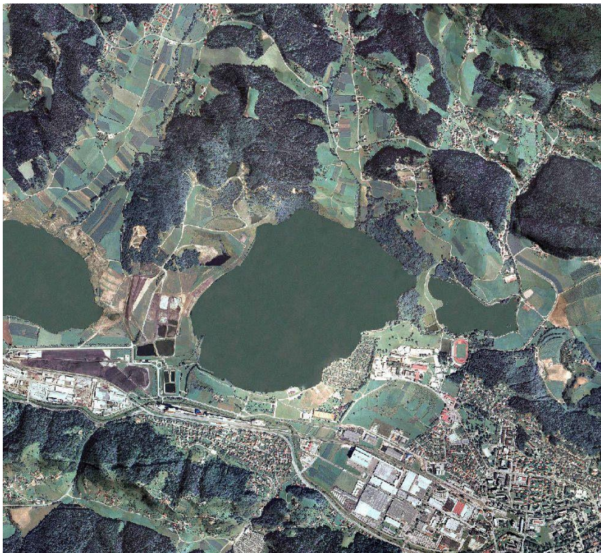
Slika 1: Šaleška jezera

Šaleška jezera so posledica izkopavanja lignita, ki ga v Šaleški dolini izkoriščajo že sto trideset let. Premogovniške ugreznine so nastale sredi kotlinskega dna Šaleške doline, ki je bilo pred tem v veliki meri v kmetijski rabi, delno pa seveda tudi poseljeno. Tam, kjer so danes jezera, je bilo več podeželskih naselij, ki so delno ali v celoti izginila (Škale, Družmirje, Preloge). Podoba doline se zaradi premogovništva še vedno spreminja, prav tako se spreminjajo tudi šaleška jezera.