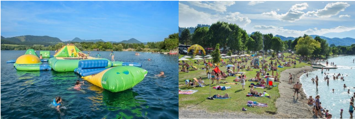
Slika 4: Velenjska plaža poleti

Velenjska plaža se lahko pohvali z dvema otroškima igriščema. Eno je na kopnem ob čolnarni in eno v vodi. Vodni park je eden izmed največjih in eden najbolj obiskanih v Sloveniji, ki ga ob lepem vremenu dnevno obišče preko 600 otrok. V sklopu lokala na plaži so na voljo dodatne plačljive vsebine za otroke (trampolin in bazen z električnimi vozili).