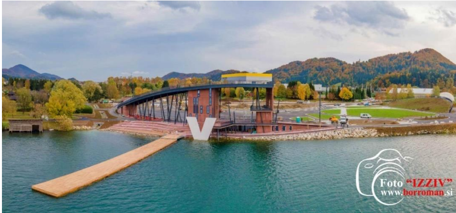
Slika 2: Park Vista

V parku Vista se nahajajo tudi prostori TIC-a Velenje, ki so za goste odprti v poletnih mesecih.