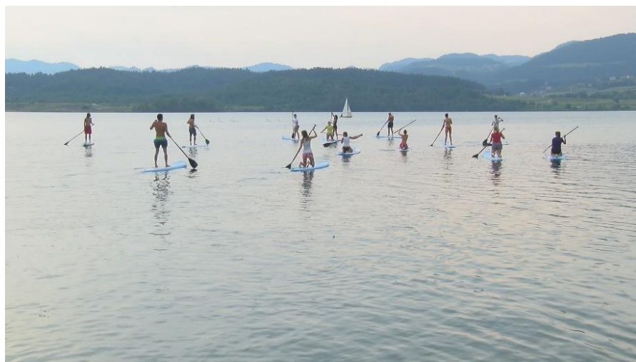
Slika 3: Supanje na Velenjskem jezeru

V poletnih dnevih so trdi in napihljivi supi na Velenjskem jezeru zelo popularni. Supanje po njem vodi v bližini lepih plaž, mimo urejenih piknik kotičkov in senčnatih sprehajalnih poti. Jezero je popoln poligon za začetnike na supu. Supanje je tudi primeren šport za malčke in mlajše otroke. Otroke zaščitijo z napihljivimi jopiči in potem lahko mirno zajadrajo po jezeru.