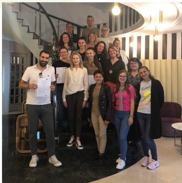
Partnerji projekta E-MotiOn

Poleg omenjenega, so partnerji namenili čas tudi drugim temam kot so promocija in evalvacija ter načrtovanje LTTA v Bolgariji (Sofija) januarja 2024.